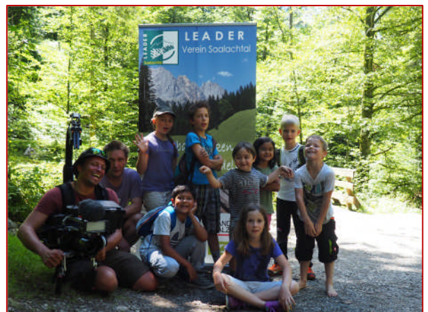
Dreharbeiten Sommer 2016 – Seisenbergklamm mit Kindern aus Weißbach