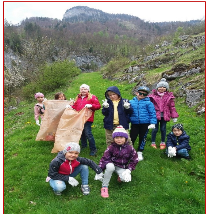
Die Schüler bei der Müllsammelaktion

Gerne werden wir wieder Müll sammeln gehen, um unser Weißbach sauber zu halten!