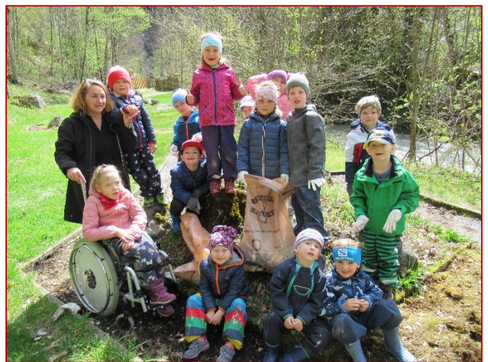
Auch die Kindergartenkinder halfen bei der Sammelaktion fleißig mit