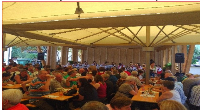
LEADER-Projekt: Festplatz Weißbach

Bereits seit fast 20 Jahren gibt es im Saalachtal die Möglichkeit, verschiedenste Projekte mit LEADER-Fördermitteln zu unterstützen. In der aktuellen Förderperiode stehen noch Mittel zur Verfügung . Wer also eine Projektidee hat, kann sich gerne beim LEADER-Team ( info@leader-saalachtal.at ) melden.