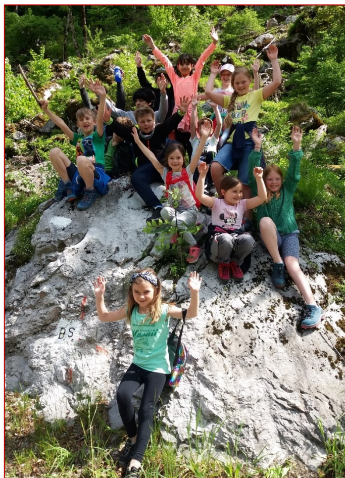
Die Schüler der Naturparkschule beim Aktionstag

Facebook: www.facebook.com/naturpark.weissbach